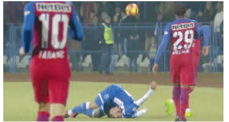
Az év esése: ilyenét még nem is láttunk!