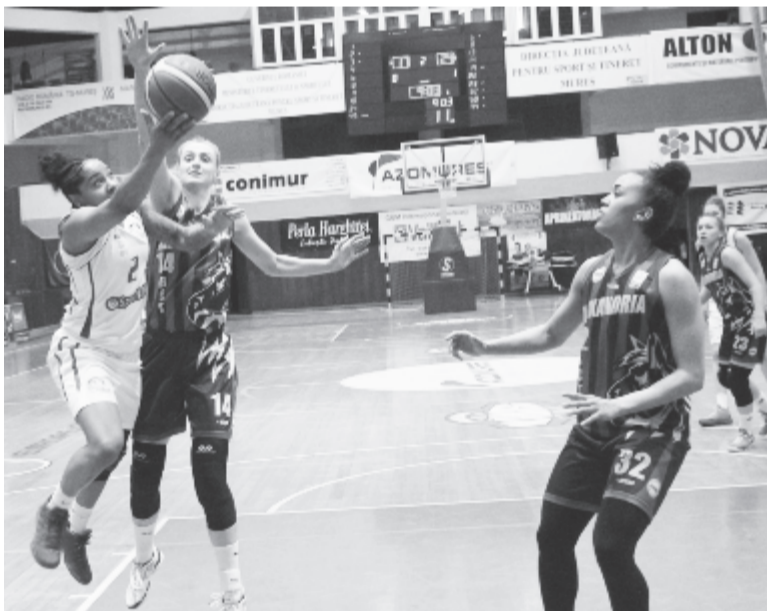
Az amerikai bedobó (b) egyedül szerzett 45 pontot.

Női kosárlabda, középszakas, felsőház, 2. forduló: Sepsiszentgyörgyi Sepsis SIC – Galaci Phoenix 88:61, Brassói Olimpia – Szatmárnémeti CSM 61:72, CSM Târgoviște – Kolozsvári U 58:53; 3. forduló: Brassói Olimpia – Sepsiszentgyörgyi Sepsis SIC 45:79, Kolozsvári U – Galaci Phoenix 81:73, Szatmárnémeti CSM – CSM Târgoviște 50:65. Alsóház, 2. forduló: Marosvásárhelyi Sirius – CSBT Alexandria 75:77, Jászvásári Poli – Aradi ICIM 59:77.