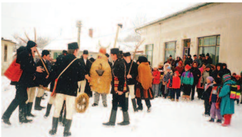
Elkel-e a kászoni bika vagy megütik? (2000)

Görényüvegcsűrön – a katolikus székely településekhez hasonlóan – háromnapos, több elemből álló szokásrenddel és tánccal fejeződött be a farsang. Utolsó napjaiban bekormozott arcú, rongyos ruhájú csákós masz-