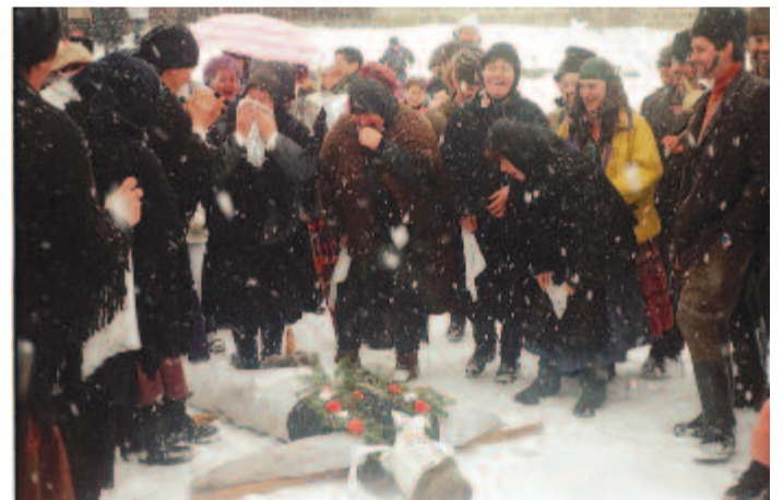
Illyés siratása – asszonyi önkifejezés (Alsósófalva, 2006)

Végül a gyergyóditrói farsangtemetés 1991-es változatának utolsó jelenetét szeretném felidézni. Hamvazószerdán délután előállt az ökrös szekér, feltették a kitömött