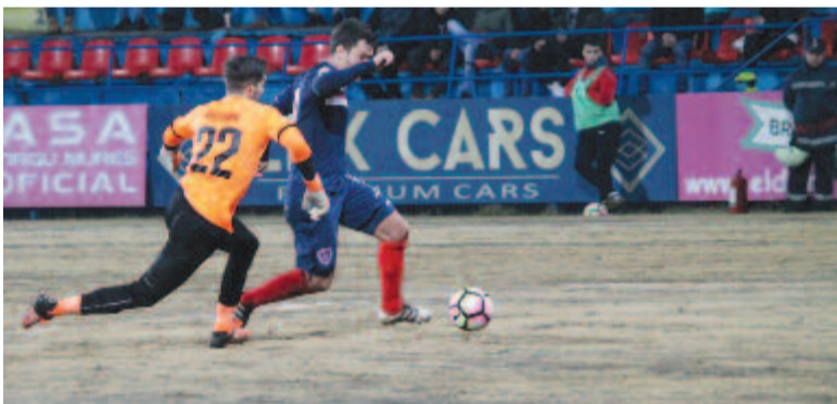
Ciolacu szépen elfekette Balaurut, de némileg oldalra sodródott, és az oldalhálóra lött.

Az első játékrészben a hazaiak játszottak jobban, elszántabban, több alkalommal próbára tették Balaurut, a Voluntari kapusát, aki 2011