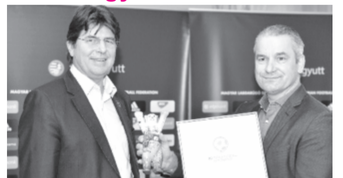
A 2012-ben alapított és azóta évente odaítélt elismerést azok a német futballszakemberek kapják meg, akik külföldön dolgoznak, és amellyel, hogy kimagasló eredményeket érnek el, viselkedésükkel, példamutatásukkal jó hírt visznek Németországnak.

„Ennél a díjnál már a jelölés ténye is fontos, az elismerésre jelölt mindhárom szakember munkájára büszke lehet Németországnak. Az elismerést odaítélő zsűri több kritériumot is megvizsgál, mikor kijelöli a három esélyes szakembert, illetve amikor kiválasztja a nagykövet személyét, így az elért sikerek mellett például a viselkedését, példamutató magatartását is” – fogalmazott Roland Bischof, a díj alapítója, aki néhány napot Budapesten tölt, megfigyeli Bernd Storck munkáját, illetve azt is, milyen körülmények között él,