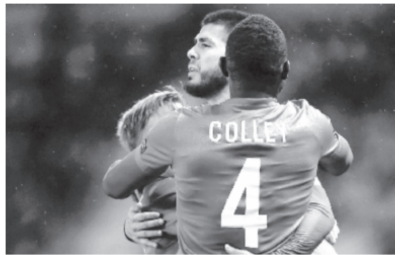
Csodálatosan szép szabadrúgásból szerzett Pozuelo, a spanyol csapatkapitány gyakorlatilag eldöntötte a továbbjutás kérdését a román bajnok elleni mérkőzésen.

Búcsúzott a sorozattól az Astra Giurgiu: a román bajnokcsapat a 2-2-es hazai döntetlen után Belgiumban egy gólos vereséget szenvedett a Genk otthonában. Esélye pedig lett volna a továbbjutásra, hiszen a visszavágón nem játszott alárendelt szerepet, és főként az első félidőben többször is bevehette volna ellenfele kapuját, azonban a helyzeteket rendre kialakító Budescu vagy elhibázta a lövést, vagy nem játszotta meg Teixeira, amikor kellett volna, így a nagy ziccernek rendre kimaradtak. A második félidőben pedig az Astra játékmestere már nemigen került a labda útjába, a Genk egyre gyakrabban veszélyeztetett, egy vitatott bal oldali szabadrúgásból pedig a belgák spanyol csapatkapitánya, Alejandro Pozuelo a rosszul he-