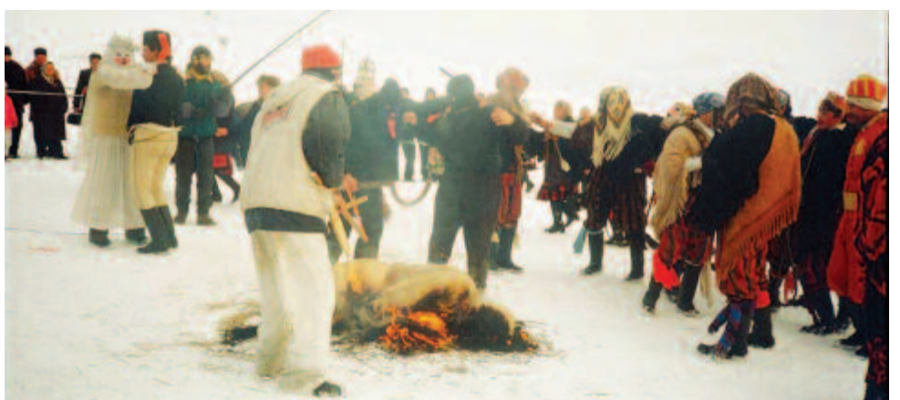
Farsang végi világ: ég a bábu, ölelkezik az új pár (Gyergyóditró, 2000)

szalmabábút, melléje ült a doktor, a két ördög és a halál . Indulhatott a vidám temetési menet, két óra is lehetett, míg a hosszú Fel-szegen lejöttek. Az ördögök és a halál le-le-ugrált a szekérről, megfogták, meg-megölelgették a leányokat és asszonyokat. A főutcán kifogták az ökröket, legények fogóztak a rúd mellé. Kétszer megkerülték a teret, aztán irány a temető melletti rét. Meséli, hogy régebb kivitték a hegyre, meggyújtották és kerékhez kötve engedték le az égő szalmabábu-farsangot. A mostani elégetés egyszerűbb lesz. Meggyújtják a szalmát, s mikor lángra kap, az ördögök körbetáncolják. Míg ez tartott, néhány méterrel arrébb egy másik jelenet zajlott. A temetés mellett nászéjszaka? A farsangi menet vőlegénye és menyasszonya ölelkezik, táncol, majd a hora hemperedve koituszt utánoznak. A két jelenet egyszerre, egymás mellett: döbbenetes, abszurd színházi kép. De ne menjünk ilyen messzire. A farsang végi dramatikus szokásokban és játékokban a halál és a temetés mellett szinte mindig megjelennek a termékenységre utaló erotikus szimbólumok és mozzanatok. A halált, az elmúlást az újjászületés váltja fel, mint a telet a tavasz, a farsangot a bőjt.