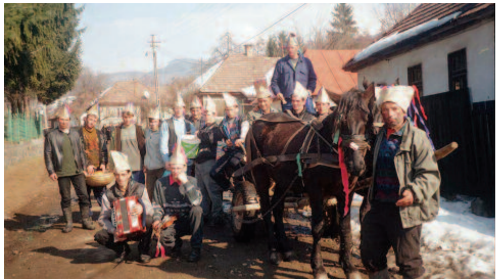
A gyűjtőgető csákósok serege Üvegcsűrön (2003)

kurák – legények és házas emberek csapata – járta végig a falut, adományokat (szalonnát, tojást, kenyeret, italt) gyűjtöttek, amit a táncban közösen elfogyasztottak. Húshagyókedden délután a falu központi terén eltemették a farsángot . A kocsmá előtt az egyik legényt (rendszerint a legittasabbat vagy a legkövérebbet) szánra fektették és betakarták szalmával. A szánt azoknak a legényeknek kellett húzniuk, akik a farsangon nem nőültek meg, vagyis agglegények . Ezen a tréfás büntetésen kívül a temetés idején nyers tojással is megdobálhatták őket. A temetésen az egyik legény papnak öltözött, és rövid, parodisztikus prédikációval búcsúztatta a sokat ivó, árokban halálát leelő, ebben jeleskedő üvegcsűri férfit. Társa, a kántor vezette a parodisztikus elemekben bővelkedő, halotti egyházi éneket utánzó éneklést, néhányan a csákósok közül sirattak. Ezután az élő halott feje felett a szalmát meggyújtották, ekkor a szánban fekvő legény felugrott és elszaladt. A temetés után tovább folytatták a táncot éjfélig. Éjfélkor a