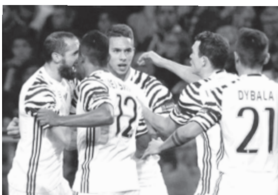
Pjaca gólját ünneplik a Zebrák.

Gólszerzők: Sarabia (25.), Correa (62.), illetve Vardy (73.).